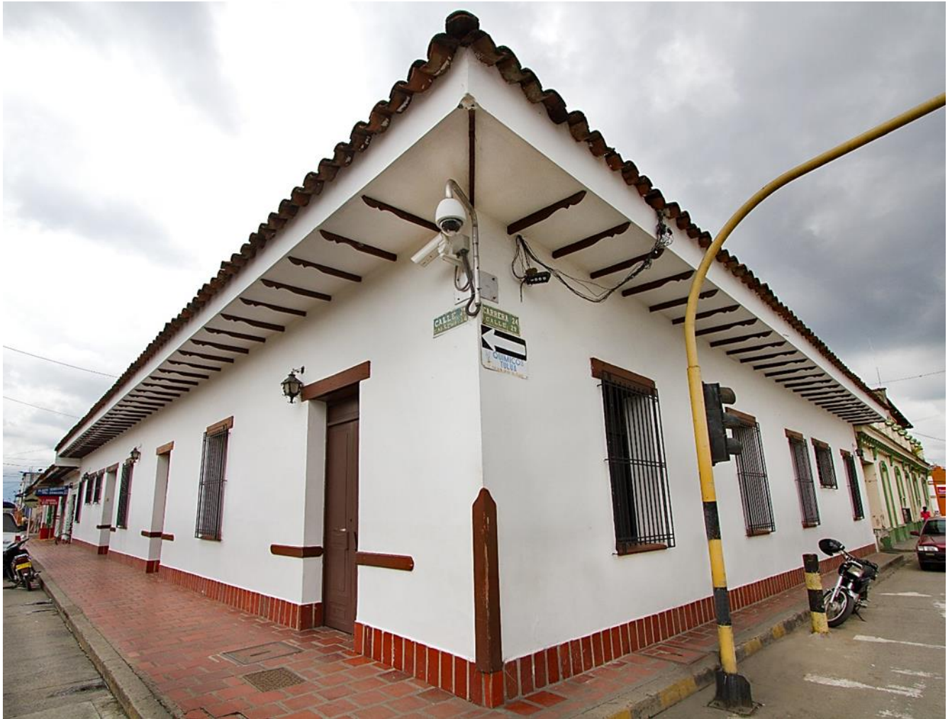
Sede CETSA – Tuluá