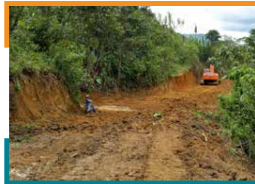
► Mejoramiento en Cerro Tijeras

En la Parcialidad Indígena Cerro Tijeras se realizaron obras de mejoramiento en 9,35 km de camino desde el Alto de Las Badeas hasta puente del río Marilopito conocido como Puente Santa Ana. La comunidad realizó una intervención con maquinaria pesada, en el marco del plan de movilidad fluvial para la ampliación de curvas y disminución de la pendiente. Con estas obras se benefician a las comunidades de las Badeas, la Cascada (Escuela), Pureto, La Tafura y Santa Ana.