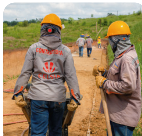
Más de 201 personas de las localidades de San Antonio y Los Laureles trabajan en Termotesorito.

Mesa de seguimiento al empleo: garantiza que los habitantes del área de influencia del proyecto participan en las convocatorias de empleo, con los beneficios laborales.