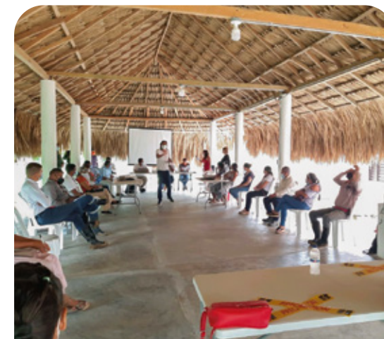
Mesa de seguimiento al proyecto realizada el pasado 9 de junio.

Mesa de seguimiento al proyecto: es el escenario de diálogo con las comunidades del corregimiento San Antonio, la vereda Los Laureles, la Alcaldía de Sahagún, la Personería Municipal y la termoeléctrica El Tesorito. Aquí se escuchan a los representantes de las comunidades y se plantean propuestas que son atendidas conjuntamente.